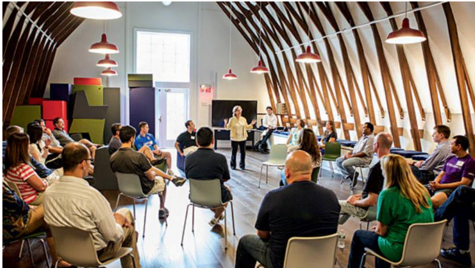
Figura 01: Modelo de Treinamento Presencial