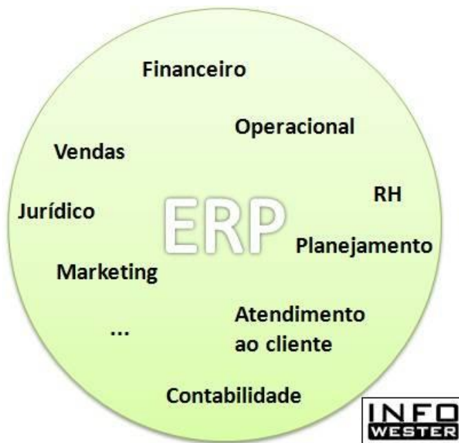
Figura 2: Alguns módulos do sistema ERP.

Ao invés de existir um software isolado para cada departamento o ERP integra todos eles facilitando assim a comunicação e evitando divergências de informações. Ele oferece também relatórios gerenciais que facilitam a tomada de decisões para os gestores.